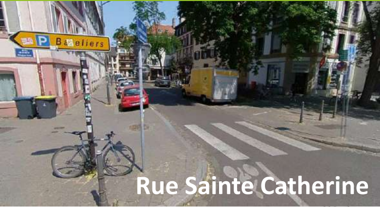
Rue Sainte Catherine