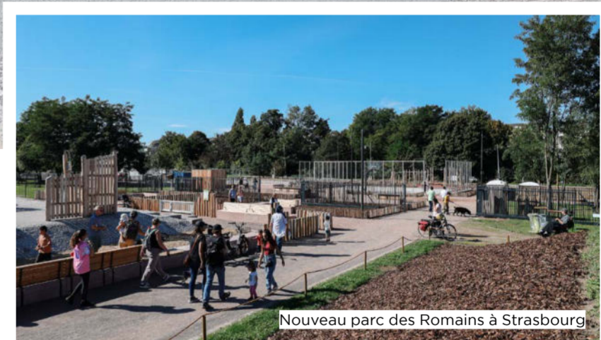
Nouveau parc des Romains à Strasbourg