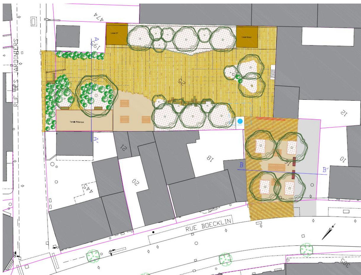
Plan présenté lors de l'atelier

Prochain Atelier sur Arbres-Végétalisation : fin aout / début septembre (date et lieu à préciser).