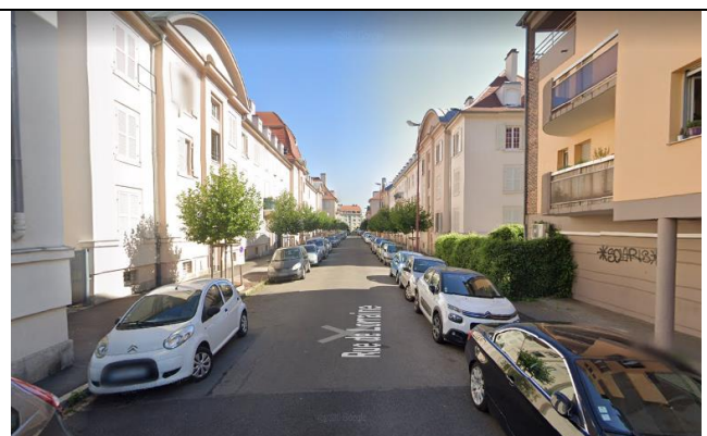
N°2 : photo de la rue de Lorraine depuis la rue de la Moselle