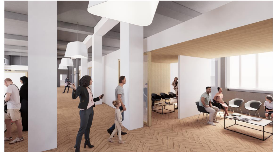
ENTRÉE : ESPACES D'ATTENTES, Y COMPRIS FAMILLES