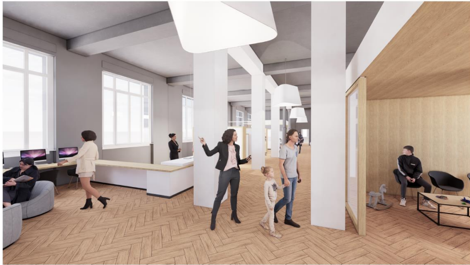
ENTRÉE : 1 ER ACCUEIL, ESPACE NUMÉRIQUE, ESPACE D'ATTENTE