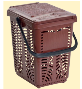
Un bioseau ajouré