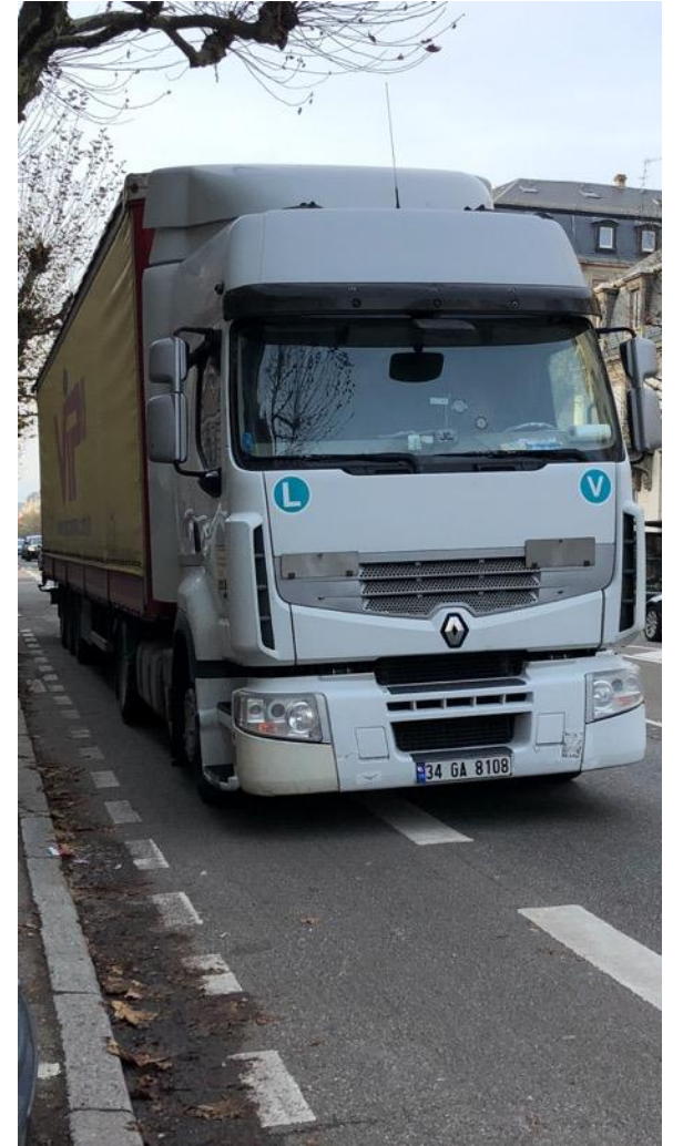
Poids lourds et plus