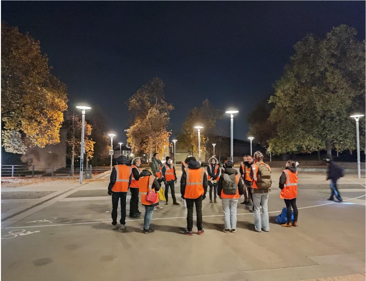
Explication du programme de la déambulation – place Hans-Jean Arp