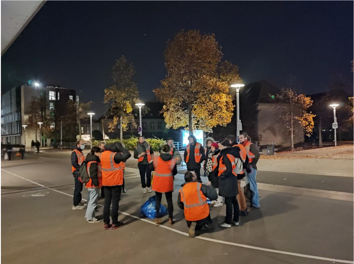
Explication du programme de la déambulation – place Hans-Jean Arp