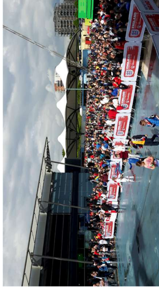
Organisation d'animations dans le périmètre de la Fanzone