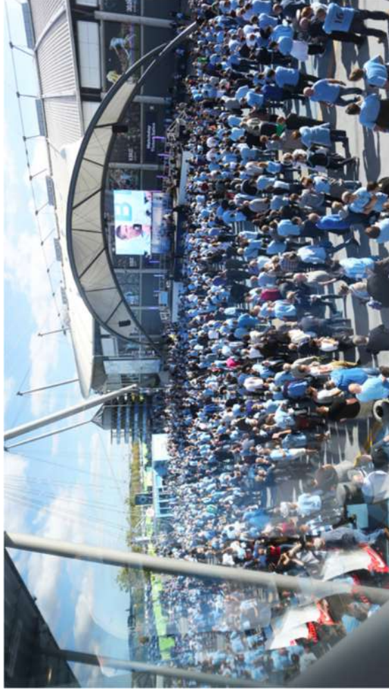
Espace scénique couvert avec écran géant.