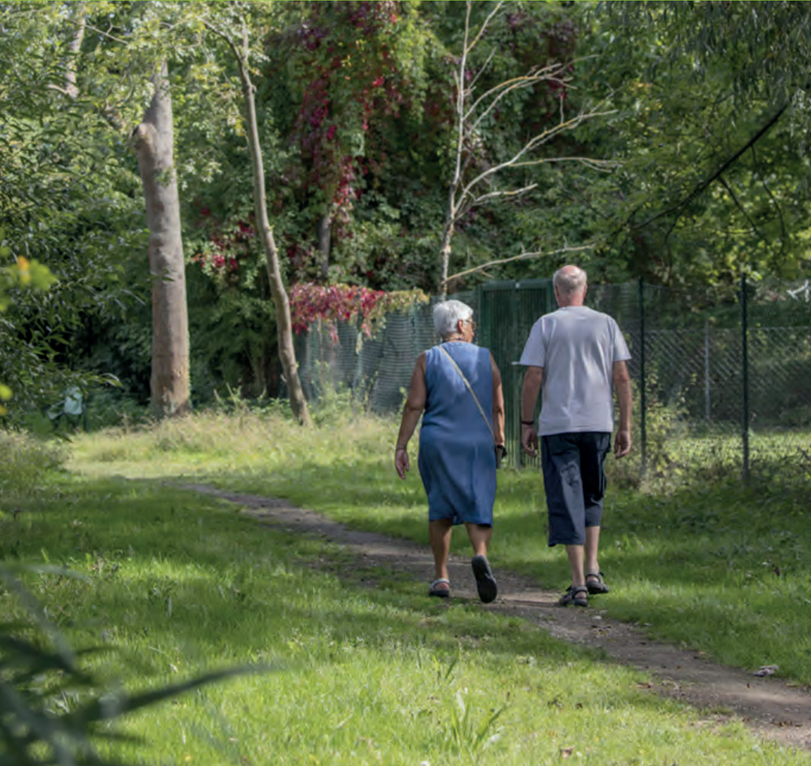
La promenade des civelles